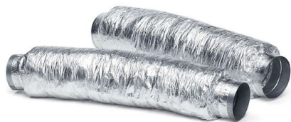
Gaine flexible silencieuse Ø 120 9700 602