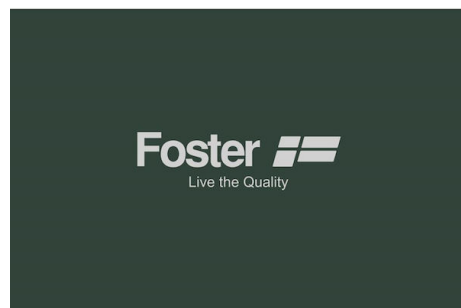
Kit de filtre à charbon 9700 221