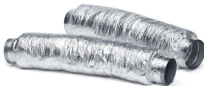
Gaine flexible silencieuse Ø 150 9700 603